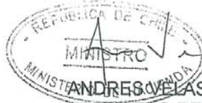
ANDRES VELASCO BRAÑES MINISTRO DE HACIENDA

Lo que transcribo a Ud. para su conocimiento Saluda atentamente a Ud.